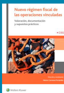
Nuevo régimen fiscal de las operaciones vinculadas

Autores: Redacción editorial Editorial: W.K - CISS Año: 2015 Páginas: 1.184 Precio: 112, 32 €