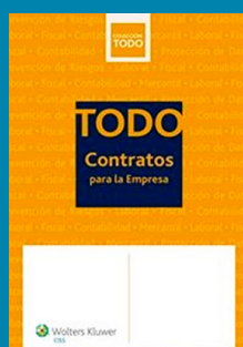
TODO contratos para la empresa

Autores: Redacción editorial Editorial: W.K - CISS Año: 2015 Páginas: 1.184 Precio: 112, 32 €