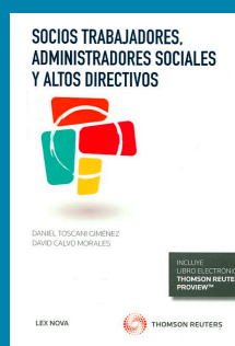
Socios trabajadores, Administradores sociales y altos directivos

Autores: Redacción editorial Editorial: F.L. Año: 2016 Páginas: 778 Precio: 82,16 €