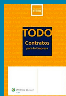
TODO Contratos para la empresa

Autores: D. Calvo y D. Toscani Editorial: Lex Nova Año: 2016 Páginas: 248 Precio: 42,00 €