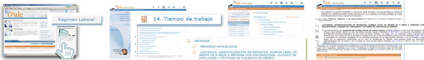
TALE EDICIÓN DIGITAL — LOCALIZACIÓN DE DOCUMENTOS MEDIANTE ÍNDICES EN TALE EDICIÓN DIGITAL