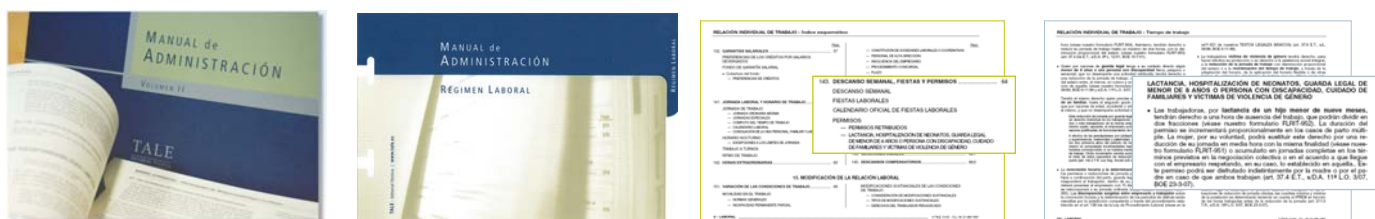
TALE SOPORTE PAPEL — LOCALIZACIÓN DE DOCUMENTOS MEDIANTE ÍNDICES EN TALE SOPORTE PAPEL.